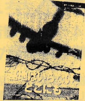
草の根運動ホームページより